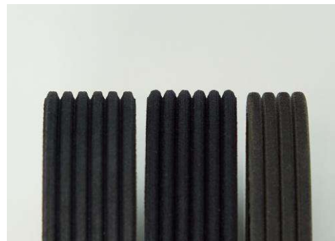
Mit bloßem Auge nur schwer zu erkennen: Die modifizierten Profilarten