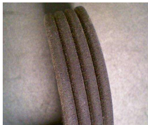
Beispiel für einen modifizierten Keilrippenriemen

Die modifizierten Riemen können uneingeschränkt für die im Katalog zugeordneten Fahrzeuganwendungen eingesetzt werden. Die neue Ausführung hat trotz der optischen Unterschiede keine Performance-Nachteile.